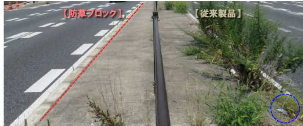
平成24年8月完成<国交省名古屋国道事務所>